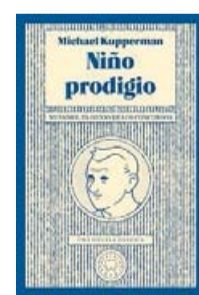
NIÑO PRODIGIO MICHAEL KUPPERMAN BLACKIE BOOKS TRAD. REGINA LÓPEZ MUÑOZ 240 PÀG. / 19,90 €

interior i capaç de respondre a la pregunta de “Papa, tu m’estimes?” amb un lacònic “A estones”.