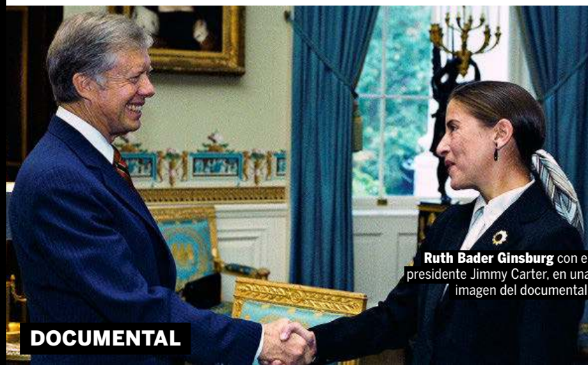
Ruth Bader Ginsburg con el presidente Jimmy Carter, en una imagen del documental.

Lo mejor: sale Ellen Page. Lola Fernández