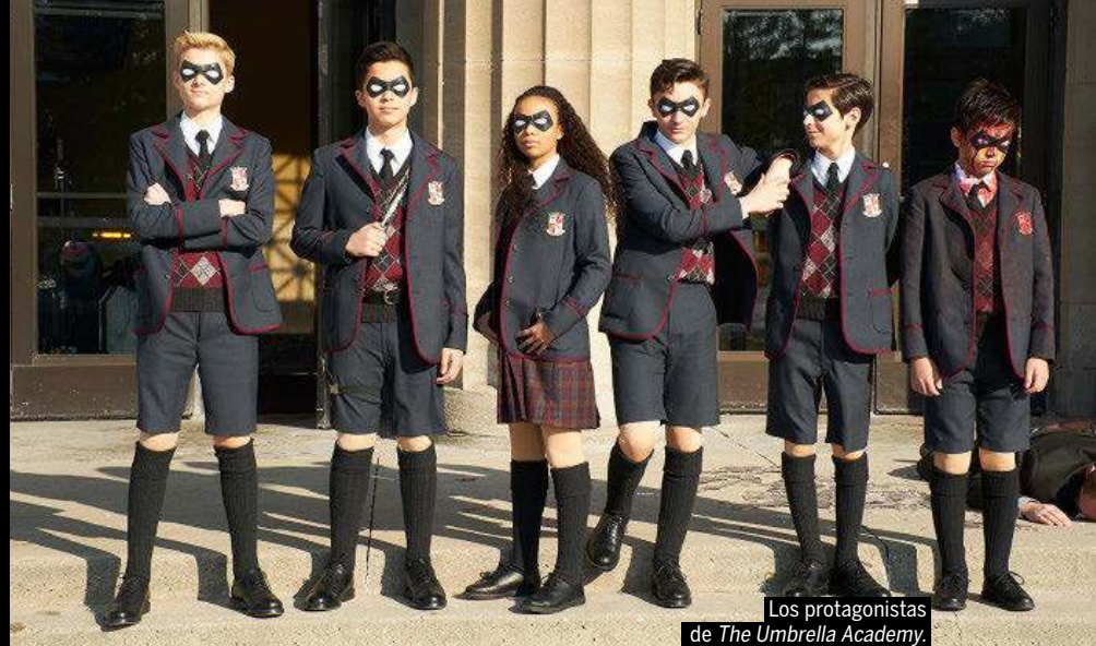
Los protagonistas de The Umbrella Academy .