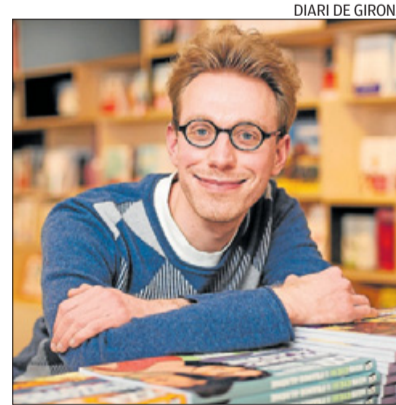
Daniel Tammet; un cervell prodigiós.

La conquista del cerebro fa un precís escaïner de la ment, de la seva naturalesa i les seves capacitats, combinant investigacions neurocientífiques amb les reflexions personals de Daniel Tammet, que ha patit la síndrome tota la vida. Analitza a més la